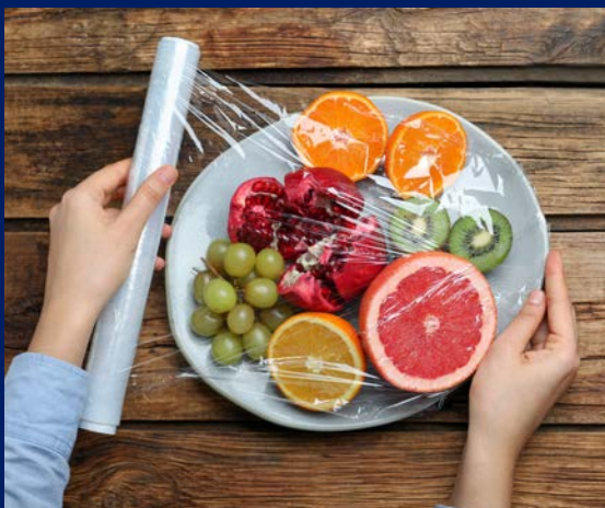
FILM Utilizare manuală și automată